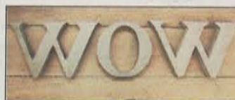
Wow! Bokstaver (fra kr 100 pr. stykk) fra Åpent Hus Interiør.