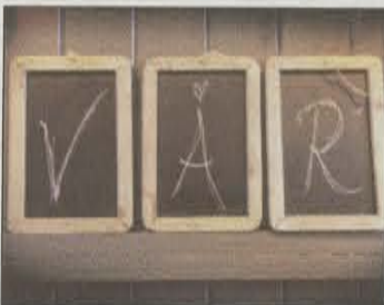
Snart vår! Små krittavler (kr 149) fra Åpent Hus Interiør, Oslo.