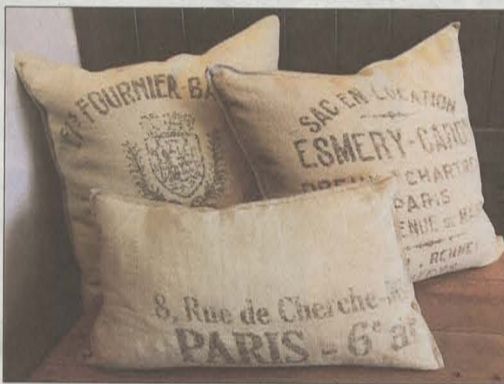
Linputer med skrift, laget av gamle franske melsekker (kr 695–1200), fra Åpent Hus Interiør.