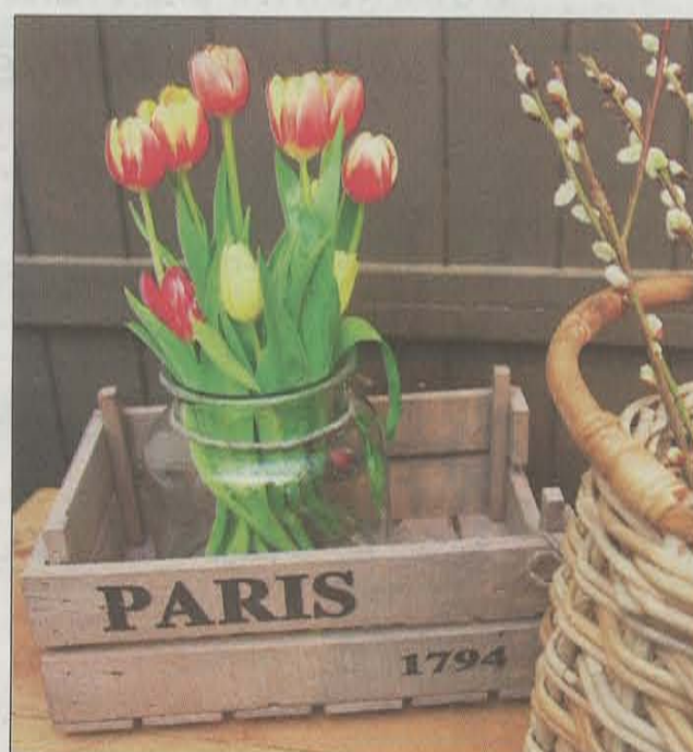
Paris-kasse (kr 349) gjør seg sammen med tulipaner og gåsunger.